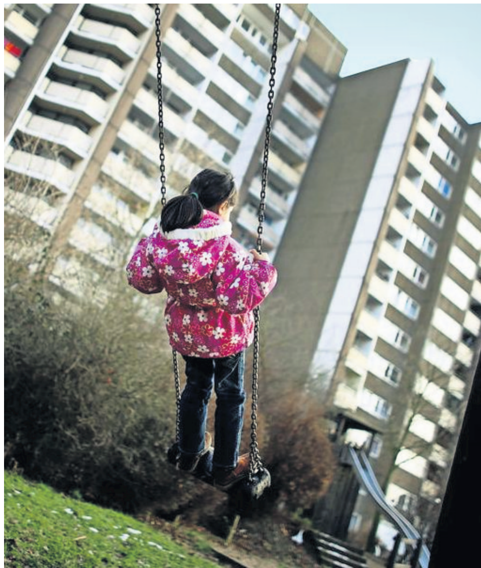
Armut hat für Kinder häufig zur Folge, ausgeschlossen zu werden. (Symbolbild).

Sophie auf die Frage nach ihren Wünschen